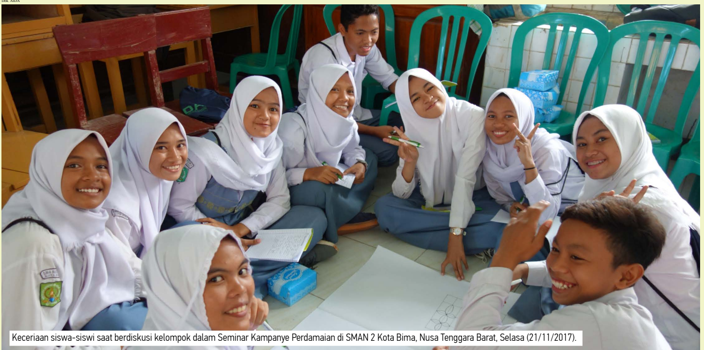
Keceriaan siswa-siswi saat berdiskusi kelompok dalam Seminar Kampanye Perdamaian di SMAN 2 Kota Bima, Nusa Tenggara Barat, Selasa (21/11/2017).

8 Kabar Utama Menghapus Dendam, Membangun Damai