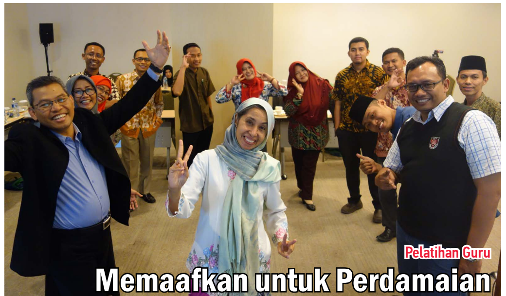
► Para peserta mengikuti sesi ice breaking di sela-sela kegiatan Pelatihan Guru “Belajar Bersama Menjadi Guru Damai” di Semarang, Sabtu (21/10/2017).